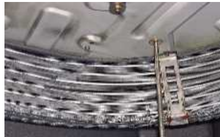
15年以上使用している