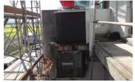
異音が発生している