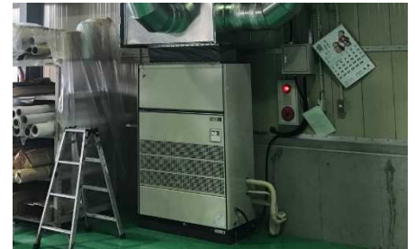
明らかに風量が衰えている

空調機・エアコンの定期メンテナンスは、工場の生産性維持、従業員の快適性向上、そして空調機・エアコンの長寿命化に不可欠です。