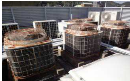
さび・劣化が激しい