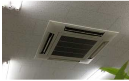
送風口から異臭がする