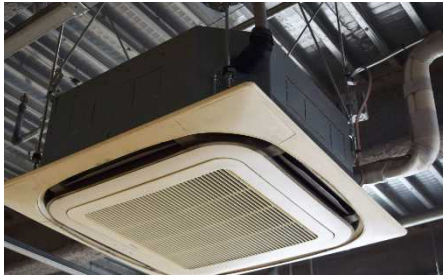
風が温まらない(冷えない)